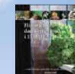
Alle deltagere får udleveret et eksemplar af denne bog

Alle kantineledere, ernæringsassistenter, fagledere og ansvarlige for fødevarer på institutioner i regi af Undervisningsministeriet inviteres til dette seminar, og vi håber at også du eller en anden fra skolen kan deltage.